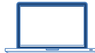
Ariba Network (e-invoicing solution)

Two channels are available for submitting invoices: