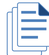
Zentraler Faktureneingang (for all paper invoices)