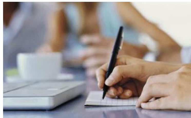
שני ערוצים זמינים להגשת חשבוניות: