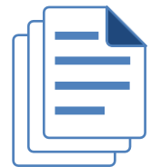
Zentraler Faktureneingang (for all paper invoices)